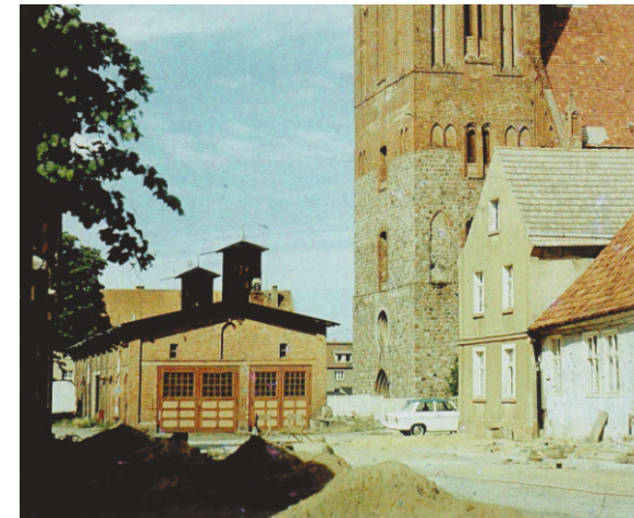
Abb. 3 deutlich sichtbare Schlauchtürme