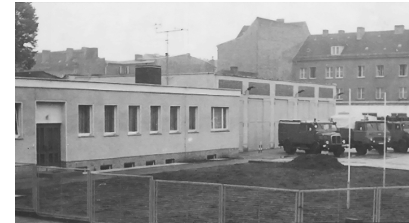
Abb. 8 Gerätehaus Grabenstraße ab 1976