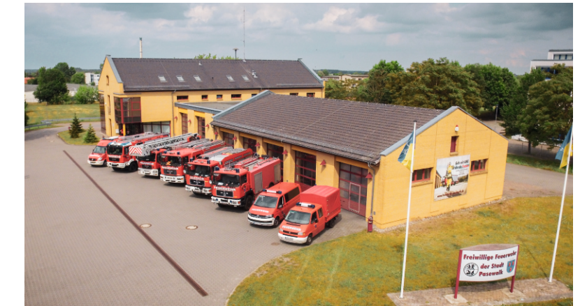
Abb. 9 Gerätehaus FFW Pasewalk Pestalozzistraße ab 2001